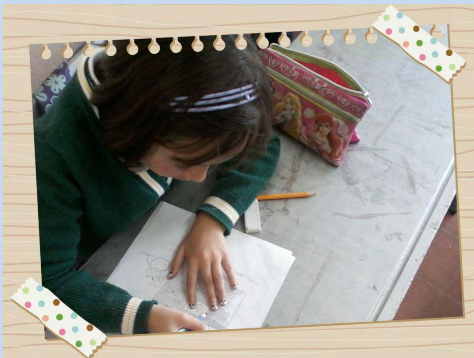
Figuras 1 y 2. Niños desarrollando Taller #2 fiesta de creaciones .