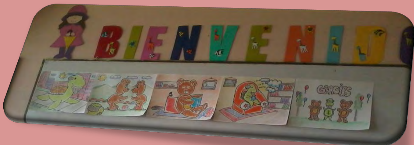
Figura 5. Dibujos realizados por los investigadores.