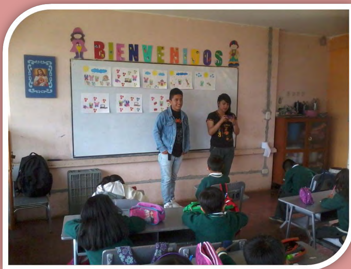
Figura 6. Investigadores narrando una historia.