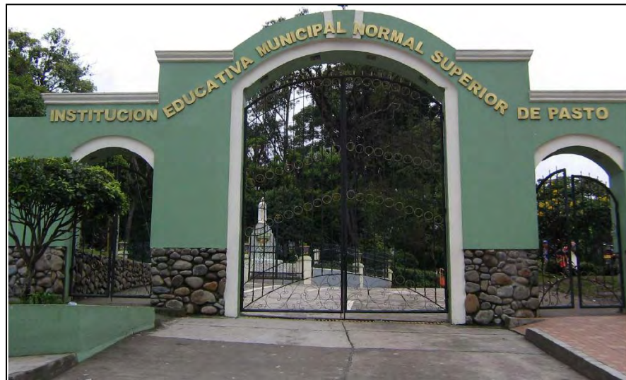
Fig. 1. Portada IEM Normal Superior de Pasto.

La presente investigación se llevará a cabo en la I.E.M Normal Superior de Pasto, donde es factible describir los siguientes aspectos institucionales: