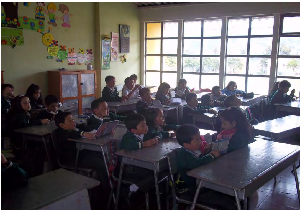
Fig. 2. Estudiantes grado segundo.