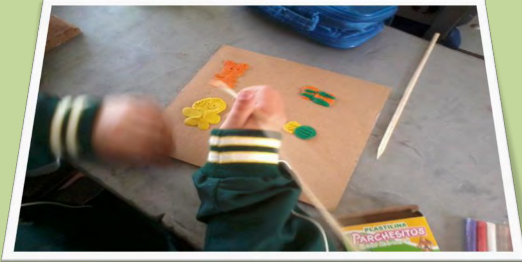
Figura 7. Niño moldeando plastilina.