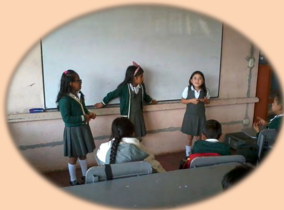
Figuras 3 y 4. Niñas desarrollando Taller #3 Teatro de Fábula .