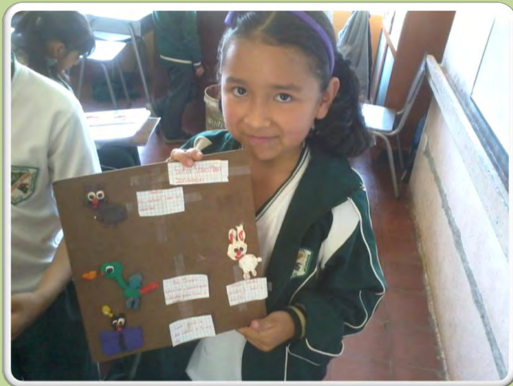
Figura 8. Niña mostrando su trabajo. Fuente: Esta investigación